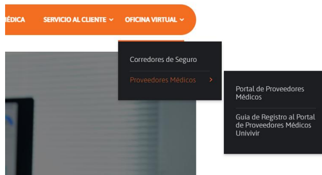
▲ Menú Oficina Virtual → Proveedores Médicos

En el menú superior, haga clic en OFICINA VIRTUAL → seleccione Proveedores Médicos.